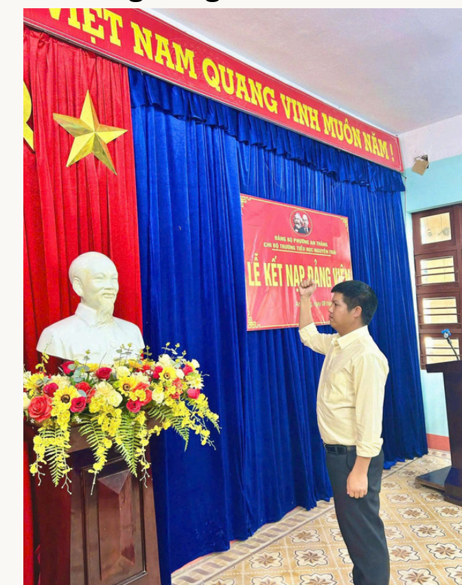
Ảnh Kết nạp Đảng viên mới

Chi bộ xác định, chất lượng đội ngũ là yếu tố quyết định sự phát triển của nhà trường. Do đó, công tác phát triển đảng viên mới luôn được quan tâm, thực hiện đúng quy trình, bảo đảm cả về số lượng và chất lượng. Trong năm qua, Chi bộ đã bồi dưỡng và kết nạp quần chúng ưu tú là giáo viên trẻ, nhiệt huyết, yêu nghề, có năng lực chuyên môn vững vàng.