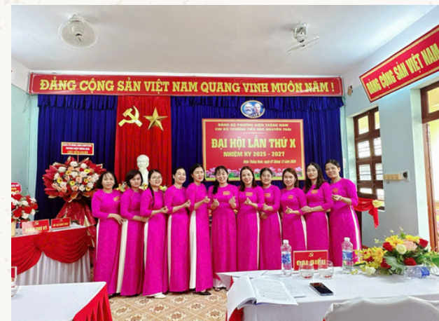
Ảnh Chi bộ Trường TH Nguyễn Trãi

Chi bộ xác định rõ: “Xây dựng Đảng là then chốt, là nhiệm vụ thường xuyên, liên tục; xây dựng Đảng tốt thì mọi phong trào mới bền vững.” Từ đó, công tác tư tưởng, tổ chức và đạo đức luôn được triển khai sâu rộng, tạo chuyển biến rõ rệt trong nhận thức và hành động của mỗi cán bộ, giáo viên, đảng viên.